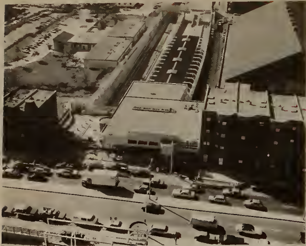
New Mass. Ave. Station, showing entry way to lobby area, trackways and transit platform. In the background is the Matthews Arena (on right) and Carter School (on left).